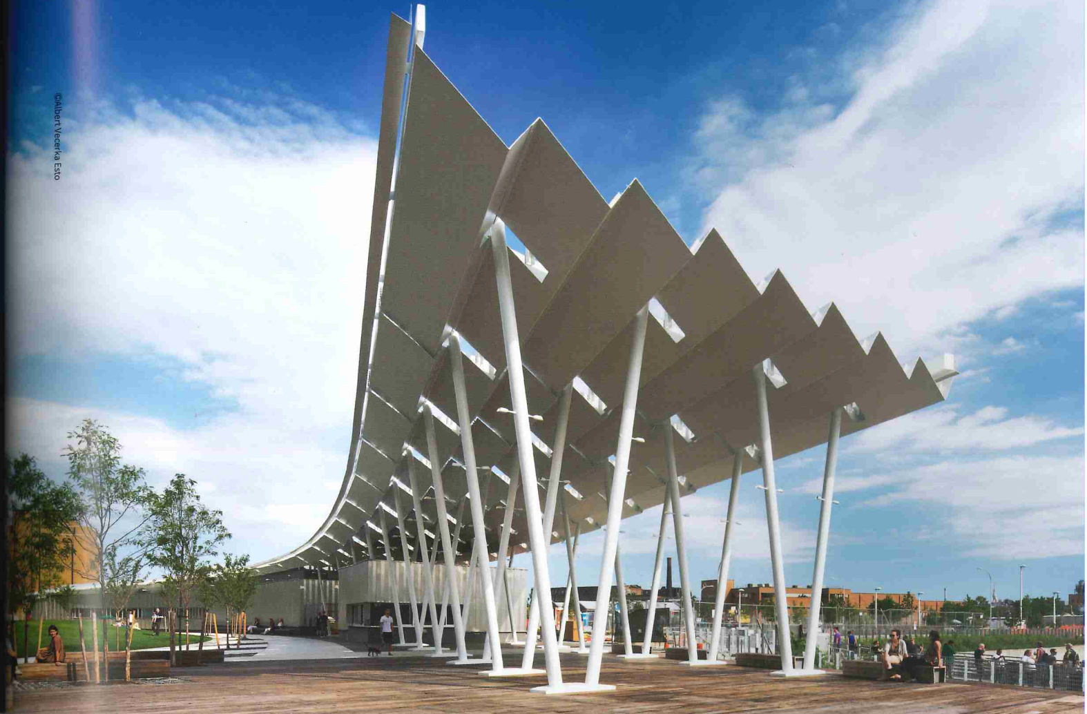
The folded plate-like shade structure reminds us of the maritime history of the last days of Hunter's Point, and has the optimal conditions to utilize rainwater and solar energy.

Framed by the pavilion and park path, an urban beach hosts sunning, picnicking, and beach