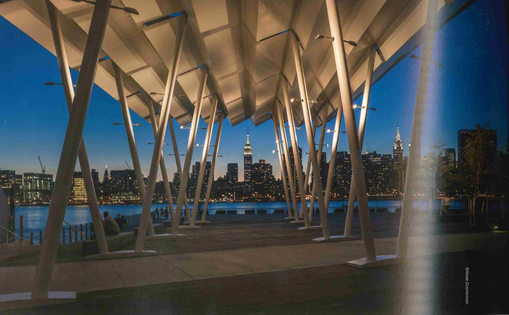
The pavilion offers 360-degree views of Manhattan's skyline and East River.